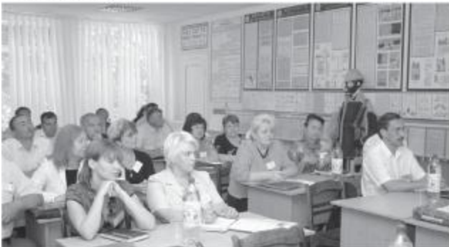
Кабинет охорони праці.

Учасники школи високо оцінили діяльність Котовського будівельно-монтажного експлуатаційного управління № 2. І це цілком закономірно та абсолютно заслужено, адже на підприємстві ведеться системна робота з