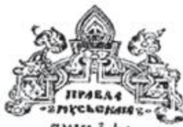
Зображення 21 Державний герб України 1709 року з написом «ПРАВДА РУСЬСЬКАЯ»

Слово «конституція» латинського походження. У Стародавньому Римі це слово позначало акти імператора, які слід було неухильно виконувати. В державах Середньовіччя, а також до останнього часу на Сході, в землях ісламу, роль конституції грали священні релігійні тексти – Біблія і Коран, які були правовою основою для релігійних судів. З появою держав, з розподілом влади і складним законодавством виникла потреба в Основному Законі – конституції сучасного типу.