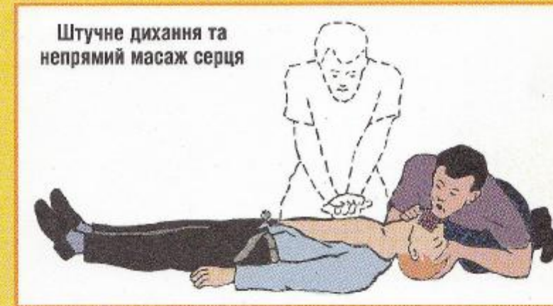
Штучне дихання та непрямий масаж серця