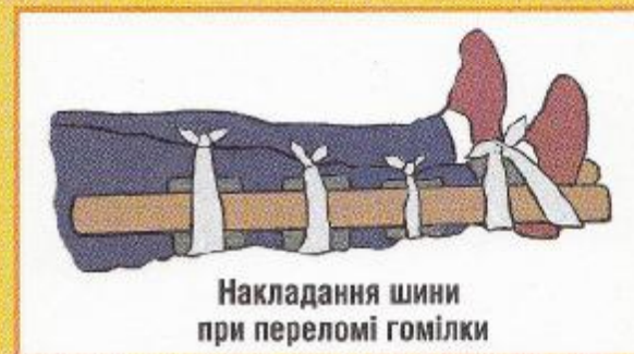
Накладання шини при переломі гомілки