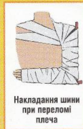
Накладання шини при переломі плеча