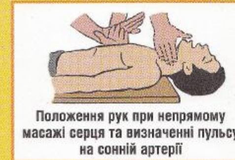
Положення рук при непрямому масажі серця та визначенні пульсу на сонній артерії

Стався нещасний випадок на виробництві? Виникло професійне захворювання?